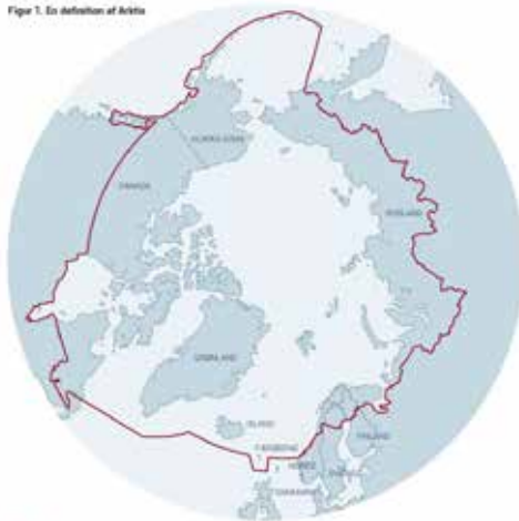
Figur 1. En definition af Arktis

Notes: HQ Support of War of 1812, Copenhagen, Norwegian Polar Institute, Young and Oberman (2014), p. 10