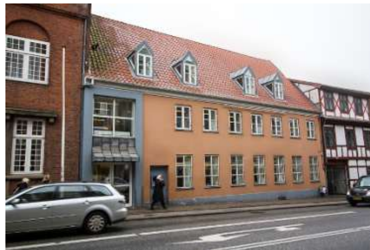
Ejendommen Vesterbro 79, Aalborg, rummer både Det grønlandske hus og fire erhvervsnetværk.

Fokus er på fremtidige muligheder for Hanstholm Havn og erhvervsvirksomheder i Thisted og Morsø kommuner.