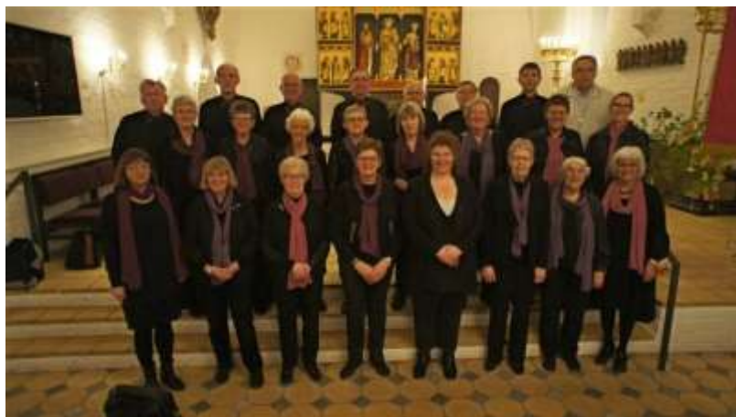
Thisted Folkekor består af ca. 30 sangere.

Thisted Folkekor giver koncert med danske sange fra Højskolesangbogen, og ind imellem er der også fællessange – alt sammen med et nordisk kulturelt perspektiv.