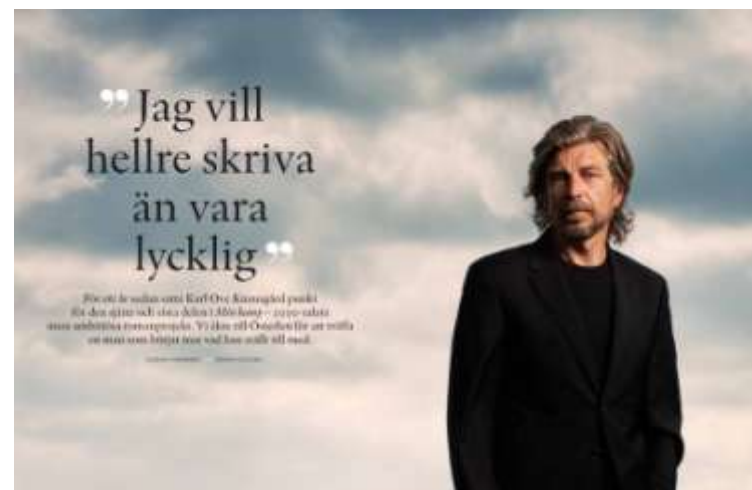
Karl Ove Knausgård, norsk forfatter, født 1968.