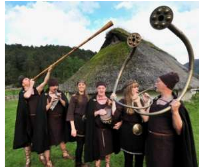
Den norske gruppe Klang av oldtid optrådte ved bronzealdermusiktræffet 25.-27. maj med rekonstruktioner af oldtidsinstrumenter, herunder to lurer skabt af den danske bronzestøber Peter Jensen.

TMCA, der har sit hovedsæde i Thinghuset i Vestervig, gennemfører i løbet af 2017 en række musikhistoriske arrangementer under fællestitlen ”Nordisk Musikværksted 2017”, bl.a. var der i Kristi himmelfartsferien bronzealderfestival.